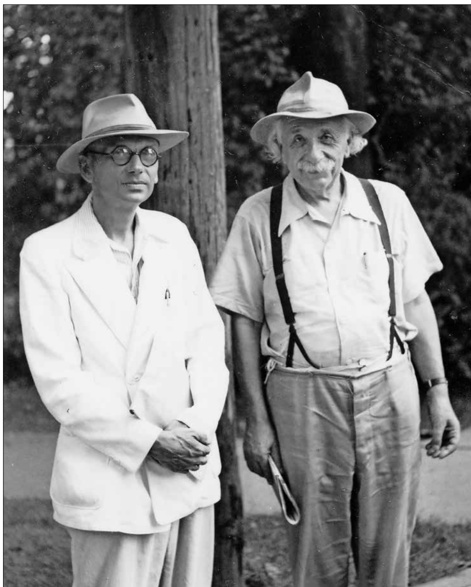
Kurt Gödel (l) moet met Albert Einstein (r) geregeld over God hebben gediscussieerd. Hij was theïst en probeerde een ontologisch bewijs te ontwikkelen om het bestaan van God aan te tonen.

Hij sprak geregeld met zijn collega en vriend Einstein tijdens de lange wandelingen op Princeton